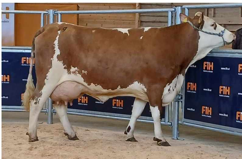
Die leistungsstarke Sehrgut-Tochter Karmina vom Betrieb Rieser, Mörschwang wechselte um € 3.500,-- den Besitzer .