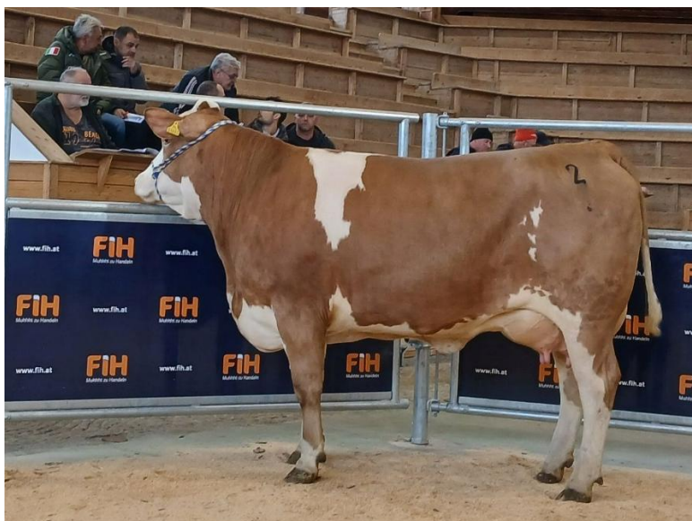
Ein größeres Angebot bei den Erstlingskühen wäre sehr wünschenswert. Im Bild die Spartacus-Tochter Zotta vom Betrieb Zauner, Tollet, welche um € 3.500,-- versteigert wurde.