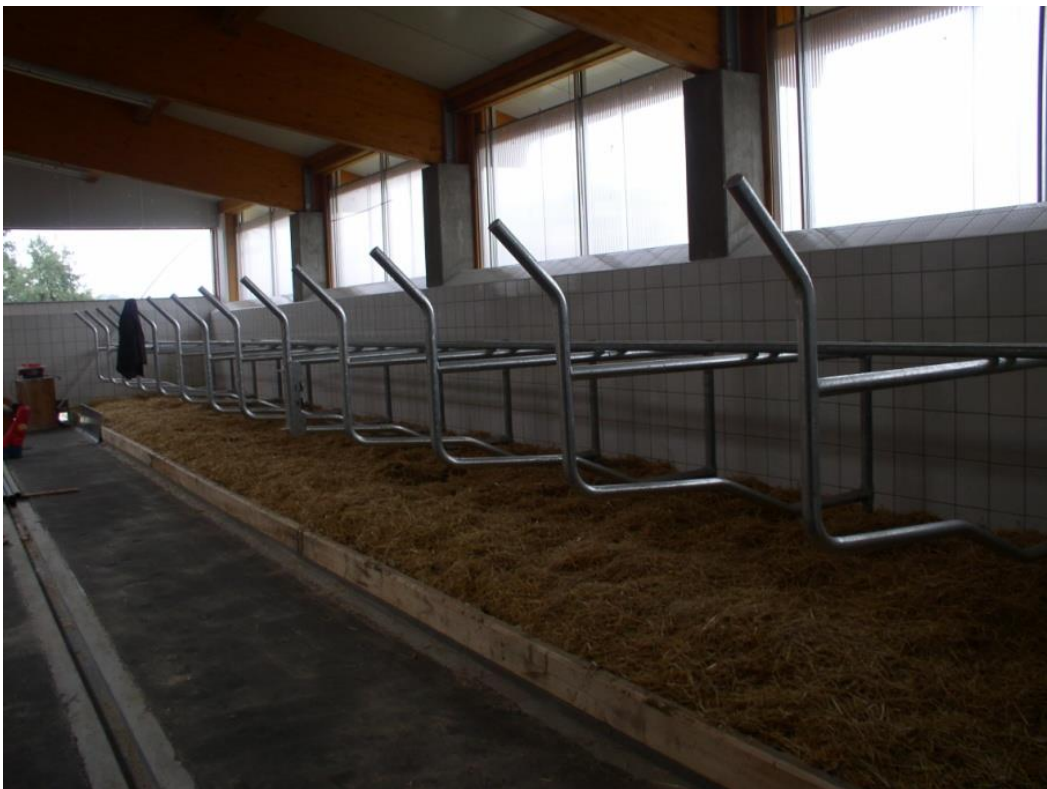
Abbildung 3: Neu angelegte Tiefboxen

Wichtig ist es anfangs gleich eine stabile Matratze anzulegen. Die Matratze darf nicht zu hart sein aber auch nicht so weich, dass die Kühe sie durchtreten.