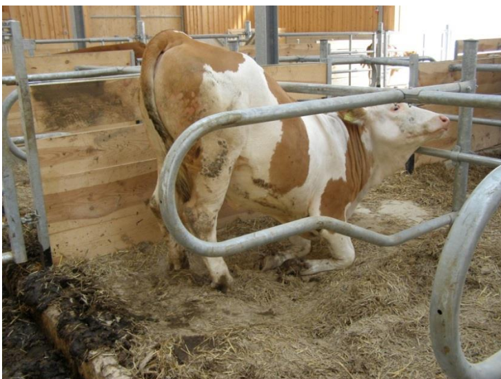
Abbildung 1: Fehlende oder falsch eingestellte Steuerelemente erschweren das Aufstehen der Rinder.