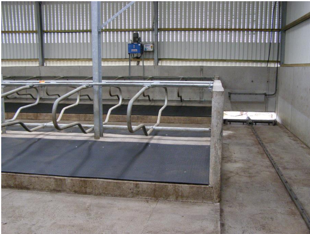
Abbildung 4: Hochboxen

Auch Hochboxen sollten unbedingt eingestreut werden, um aufgelegene Stellen an den Sprung- und Karpalgelenken zu verhindern. Steinmehl, Kalk oder Sägespäne sowie Strohhäcksel eignen sich dafür.