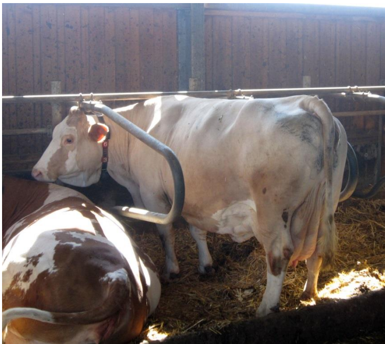
Abbildung 2: Die Kuh sollte vor dem Abliegen mit allen 4 Beinen bequem in der Box stehen können.